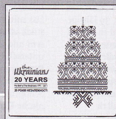
The Ukrainians '20 Years' CD